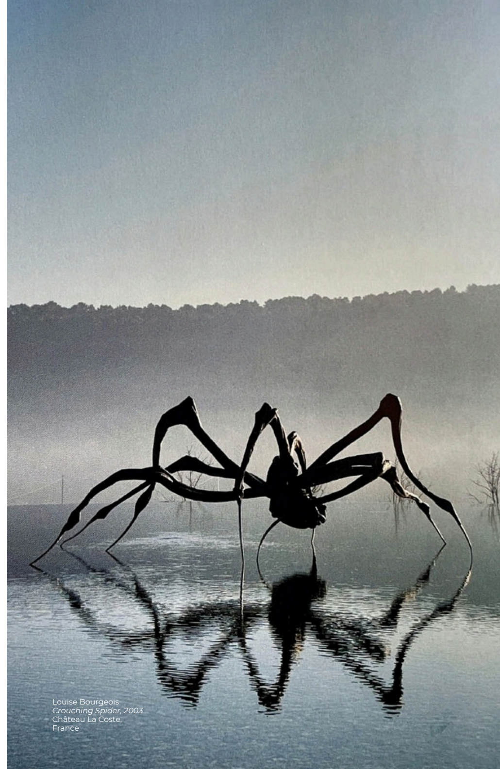
Louise Bourgeois Crouching Spider , 2003 Château La Coste, France