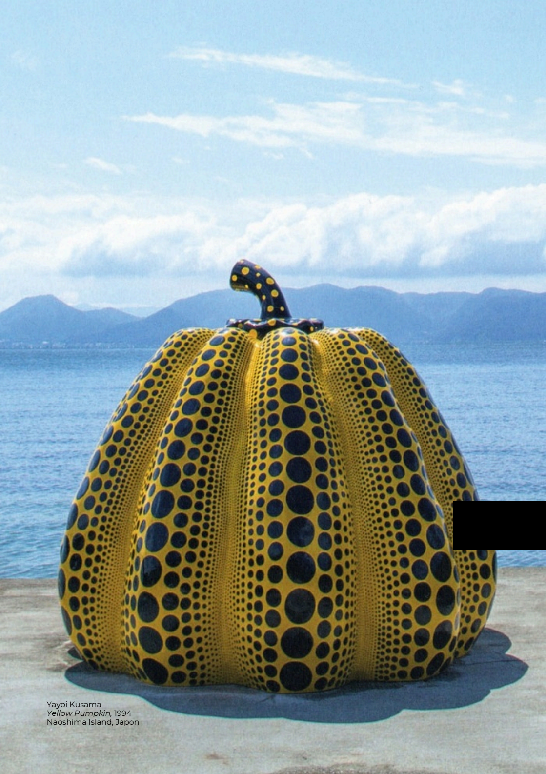
Yayoi Kusama Yellow Pumpkin , 1994 Naoshima Island, Japon

Sculpture+ est un fonds de dotation à vocation pédagogique, dédié au rayonnement de la sculpture sous toutes ses formes et accessible à tous les publics.