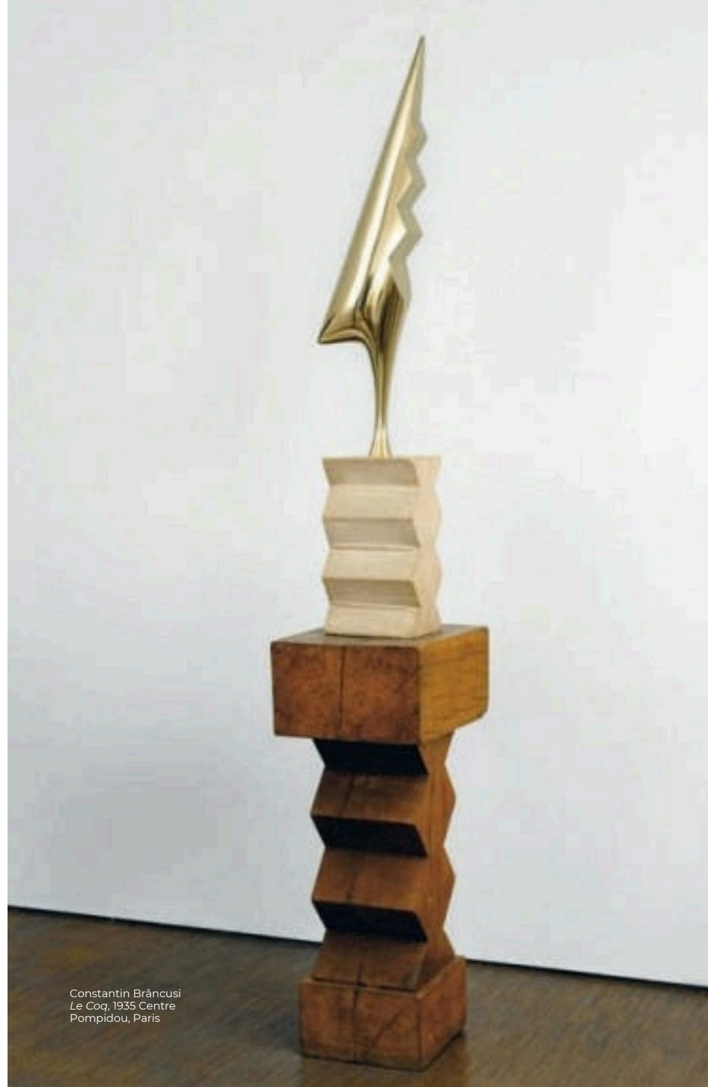
Constantin Brâncuși Le Coq, 1935 Centre Pompidou, Paris