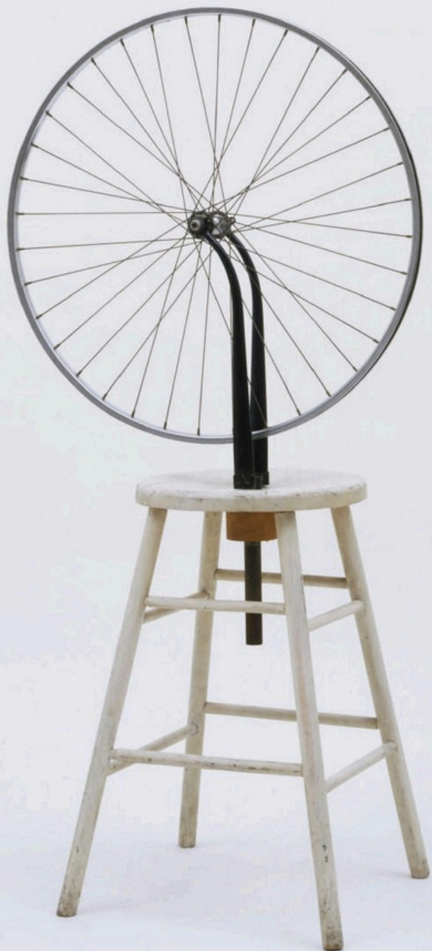
Marcel Duchamp Roue de bicyclette , 1913 Centre Pompidou, Paris

« Une sculpture n'est pas un objet, elle est une interrogation, une question, une réponse. Elle ne peut être ni finie ni parfaite. » Alberto Giacometti