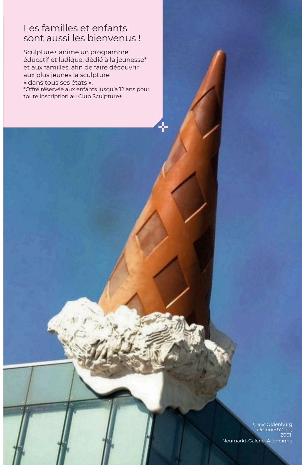
Claes Oldenburg Dropped Cone , 2001 Neumarkt-Galerie, Allemagne

*Offre réservée aux enfants jusqu'à 12 ans pour toute inscription au Club Sculpture+